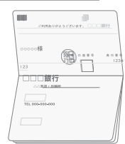
通帳のオモテ面 (表紙)